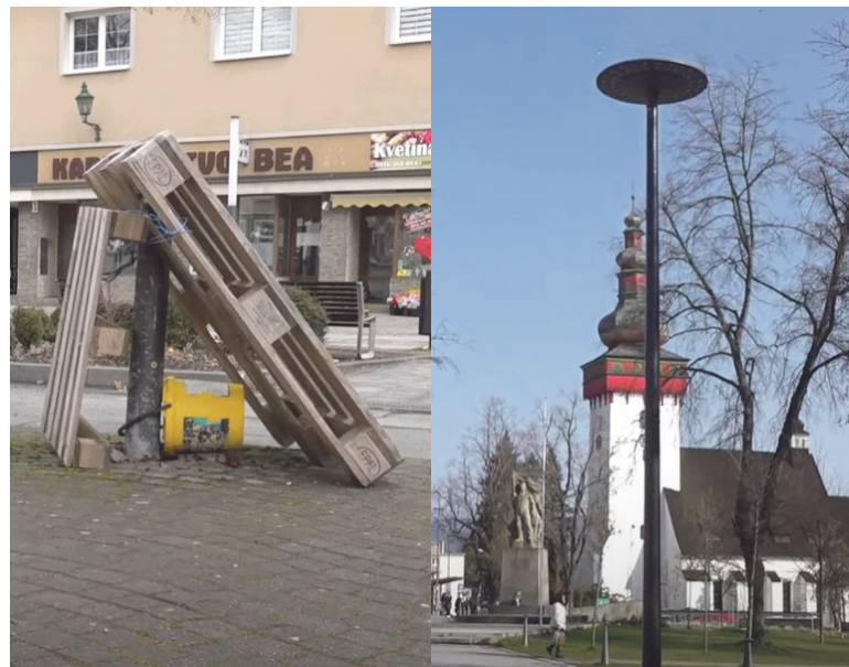
Zlomený stĺp nahradili elektrikári novým a osvetlenie je funkčné.