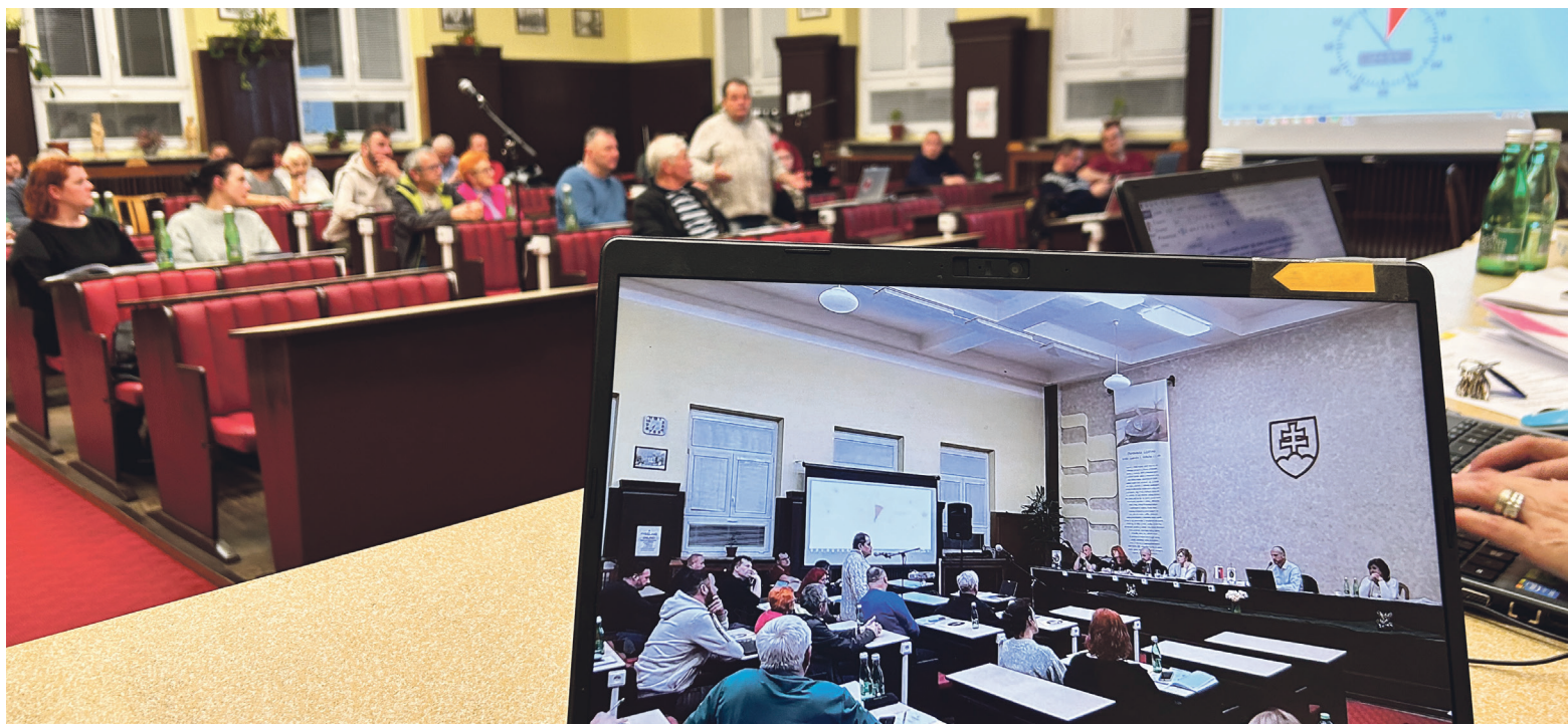
V poradí trinásťe tohtoročné rokovanie mestského zastupiteľstva trvalo viac ako 8 hodín