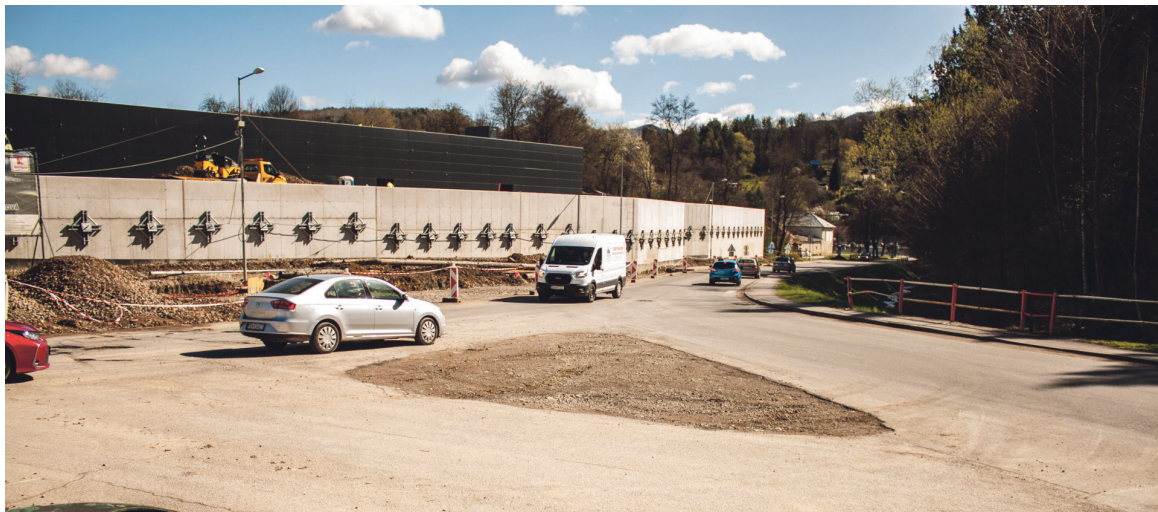
Zmena nastala v znížení rýchlosti na 30 km/h, pričom premávka ostala obojsmerná aj v smere na Ul. Okružná aj Morovnianska cesta.