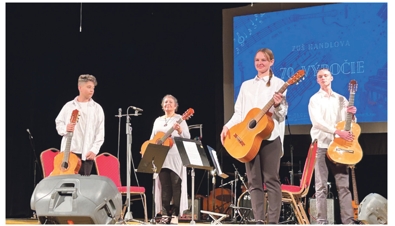
ZUŠ si slávnostným koncertom v DK pripomenula svoje založenie.

Nový odbor škola otvorila len v školskom roku 2023/24 a prví študenti sa venujú práci s témou, tvorbe scenára, práci s kamerou so zvukom a strihom,