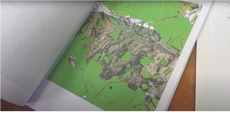
NATURA 2000 je sústava chránených území európskeho významu.