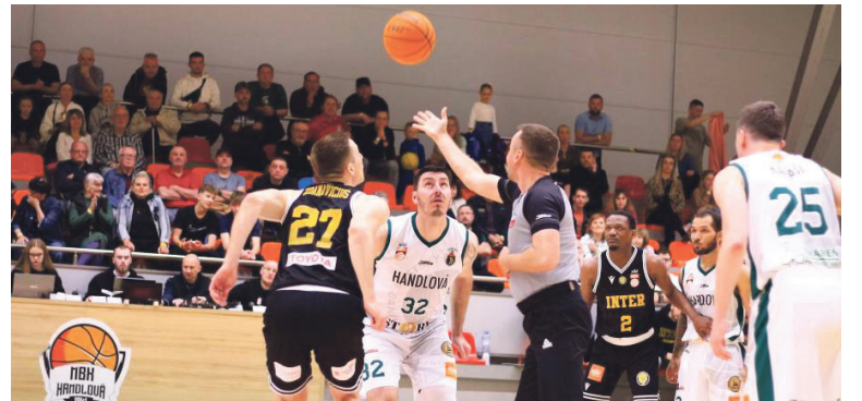
V najdôležitejšom zápase sezóny Handlová napokon neuspela.