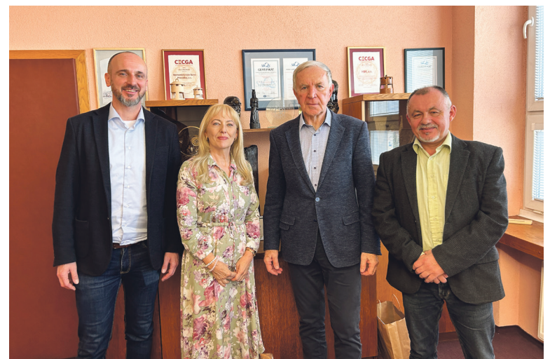
Na marcovom stretnutí sa diskutovalo na témy využitia povrchu banského areálu, banských artefaktov, rozvoja cestovného ruchu, zamestnanosti a ďalších.