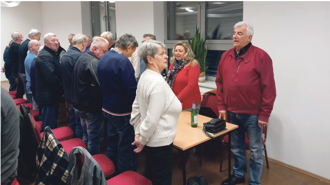
Baníci ukončili schôdzu hymnou „Banícky stav“.