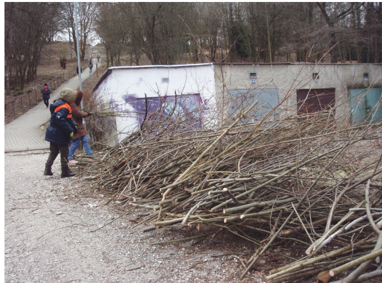
Schodisko spája ulice F. Nádaždyho a Parkovú. Vyčíslené opravy sa vyšplhali na sumu 8 295,31 Eur.