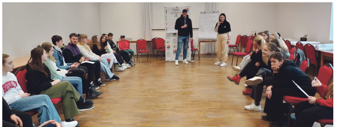
Mládežníci zdieľali svoje nápady počas trojdňového seminára v Handlovej.