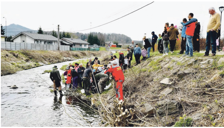
Na medzinárodný deň vody čistilo okolie Handlovky viac ako 260 dobrovoľníkov.