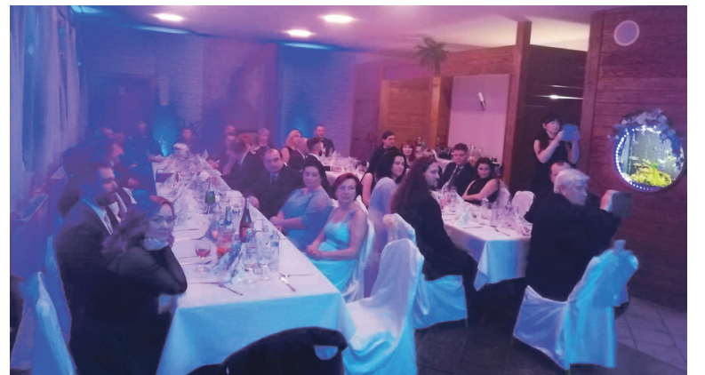
Kynológovia sa stretli na plesu už po štvrtý krát