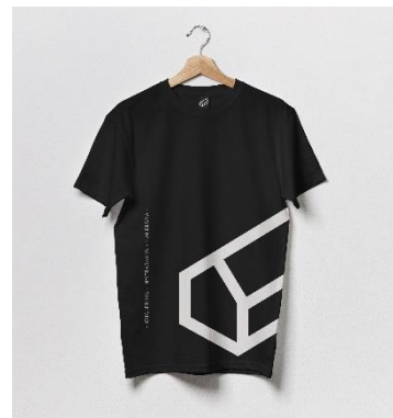
Propagačné predmety 2022 vydané mestom Handlová.