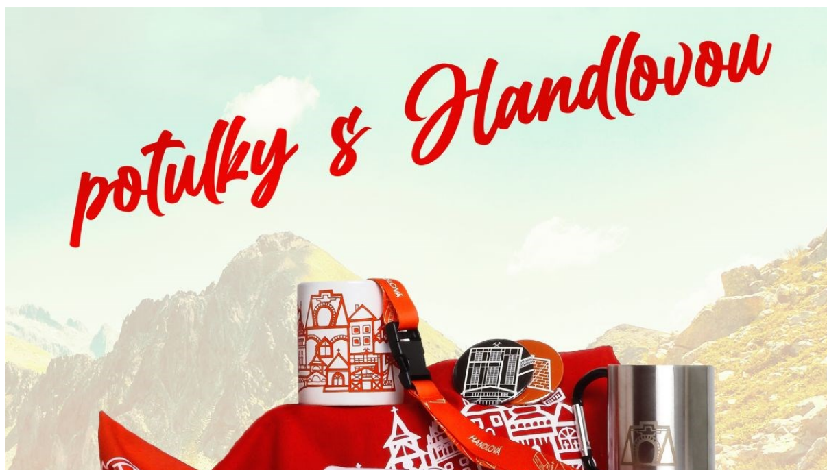
Súťaž Potulky s Handlovou